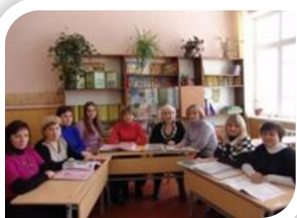
Майстер емоцій і настроїв