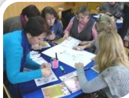
Майстер створення — констатаци знань...